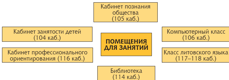
Схема 1. Помещения для занятий

104, 106, 114, 116, 117 кабинеты были обновлены и оборудованы в 2008 г. при частичном финансировании из средств Европейского Союза по проекту “Активная интеграция сегодня – успех завтра”.