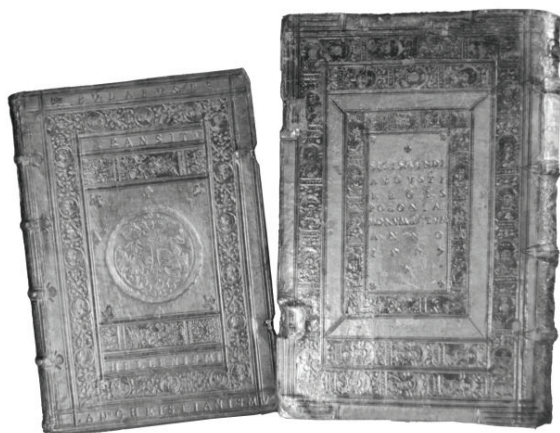
The books of Žygimantas Augustas – one of the oldest books in the library

An important event happened in 1927 - the personal library of the professor Joachim Lelewel (1786-1861) was brought from Kurnik in Poland. According to the testament of the professor, died in the emigration in Paris, the books could not be brought straight to Vilnius University. They were kept a half century in the different places and therefore they were damaged. The heritage of Lelewel (4800 books and about 400 old atlases and maps) has had a big value. Many famous libraries can be jealous. The collection of the old cartography of Lelewel is a pride of the Library of Vilnius University.