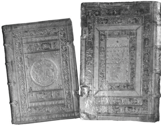
Žygimanto Augusto knygos – vienos seniausių bibliotekoje

Reikšmingas įvykis – 1927 m. iš Kurnikų (Lenkija) pargabenta profesoriaus Joachimo Lelevelio (1786–1861) asmeninė biblioteka. Pagal Paryžiuje emigracijoje mirusio profesoriaus testamentą ji iš karto negalėjo būti perduota Vilniaus universitetui, todėl pusę šimtmečio buvo laikyta įvairiose vietose ir dėl to nemažai nukentėjo. Šis J. Lelevelio palikimas (4800 tomų knygų, apie 400 senųjų atlasų ir žemėlapių) yra neįkainojamos vertės, jo gali pavydėti daugelis garsių pasaulio bibliotekų. J. Levelio surinkta senosios kartografijos kolekcija – Vilniaus universiteto bibliotekos pasididžiavimas.