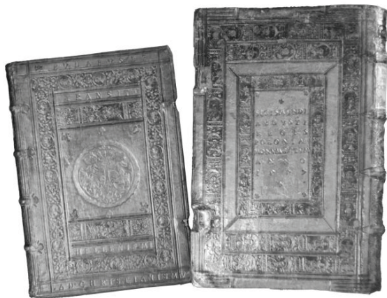
Книги Жигимантаса Аугустаса – одни из самых старинных в библиотеке

Значительным событием стало поступление из Курника (Польша) личной библиотеки профессора Йоахима Лелевеля (1786–1861). По завещанию скончавшегося в Париже в эмиграции профессора библиотека не могла быть сразу передана Вильнюсскому университету, поэтому половину столетия хранилась в других местах и по этой причине немало пострадала. Это наследие Лелевеля (4800 томов книг и около 400 старинных атласов и карт) неоценимо, ему могут завидовать большинство известных библиотек мира. Собранная Лелевелем коллекция старинной картографии – гордость библиотеки Вильнюсского университета.